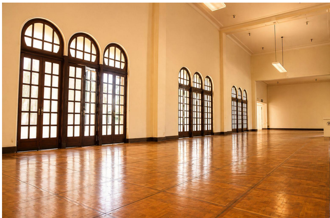
Salão de Apoio B