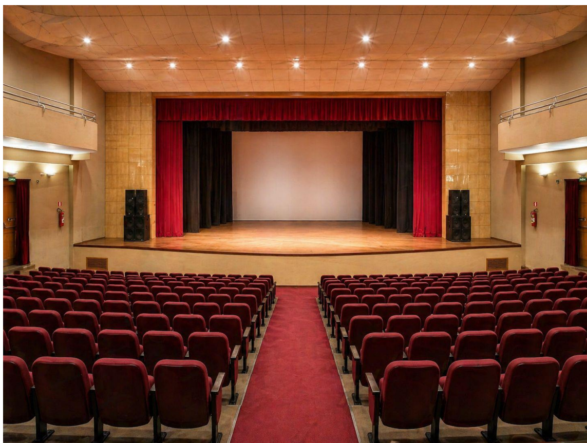
Vista da Plateia