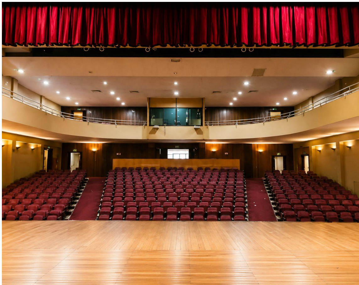
Vista do Palco