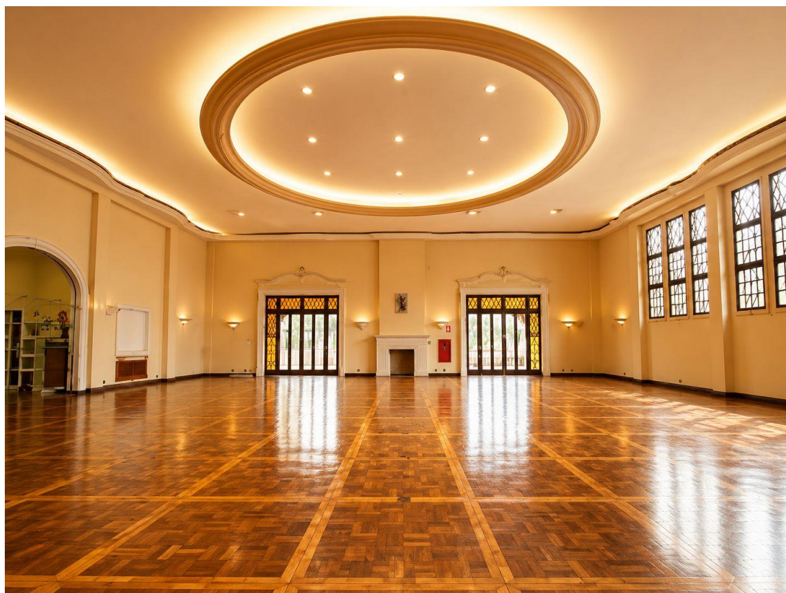
Salão de Apoio A